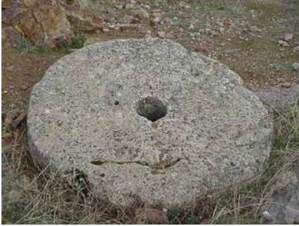
Rueda de Ur

¿Cuándo apareció?: No se conoce muy bien cómo ni cuándo apareció. La primera prueba histórica que se tiene de su existencia se sitúa en torno al 3000 A.C y pertenece a la civilización mesopotámica (la famosa rueda de Ur). Esta es un disco de arcilla con un orificio central y otros más pequeños laterales.