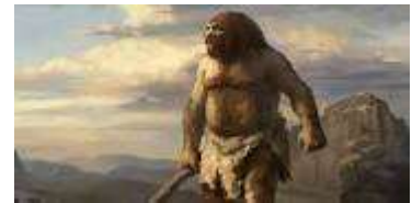
Hombre de Atapuerca

Pero no fue hasta hace 350.000 años cuando el hombre de Atapuerca comenzó a utilizarlo.